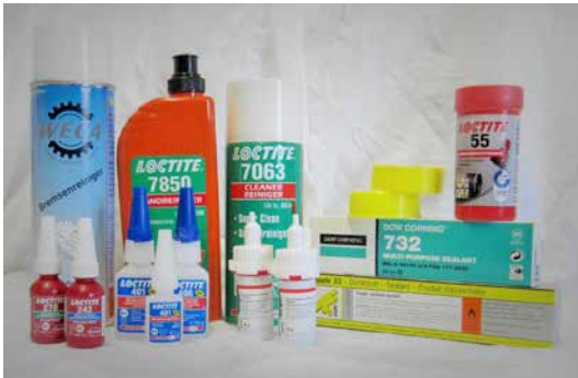
Andere Klebstoffe oder Dichtmassen auf Anfrage.